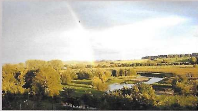
La vallée de l'Aisne au pied du Mont-de-Jeux