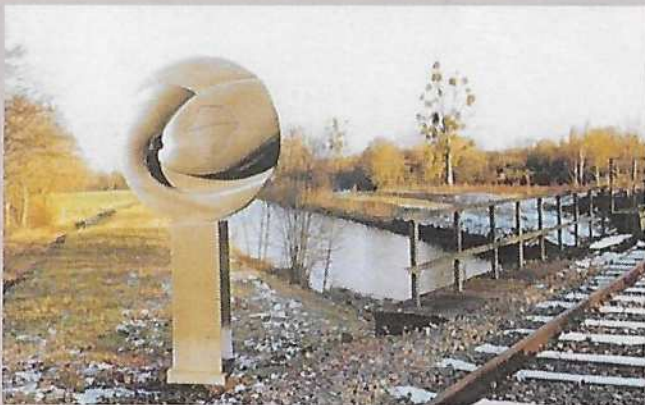
Projet d'hommage par Michel Gillet